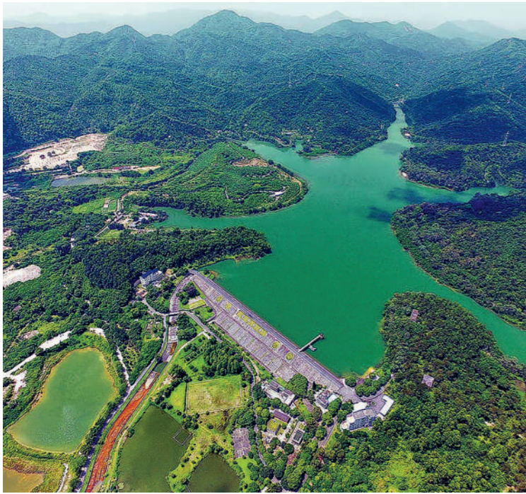
■ 中山是國內第一個榮獲「聯合國人居獎」的生態宜居城市

粵港澳大灣區（大灣區）包括香港、澳門兩個特別行政區，和廣東省廣州、深圳、珠海、佛山、惠州、東莞、中山、江門、肇慶九市，總面積約5.6萬平方公里，二零一九年底總人口逾七千二百萬，地區生產總值達一萬六千七百九十五億美元，人均生產總值二萬三千三百七十一美元。