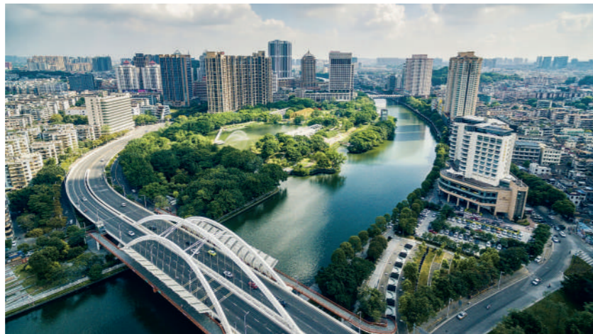
■ 中山市位於大灣區交通樞紐的黃金交叉點，擁地利優勢。

深圳對於深中通道的期待也非常大，深圳實安一直希望可以成為「環灣區中心」，據深圳市城市規劃研究院副院長單樑透露，「未來深圳將準備四百輛大巴，每天廿四小時往返作為深中通道的擺渡車，直接通到中山的重要大型居住區。」深中通道上車水馬龍的預期場景，指日可待，預測未來珠江口兩岸客貨運交通需求增長率超過百分之五，日均客運量在三十萬人次以上。實安如果加上中山一起發展，僅