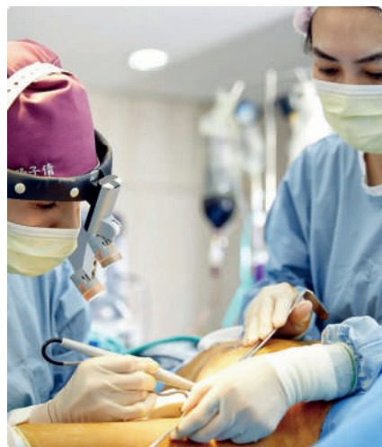
健康醫藥產業是中山其中一個優勢產業

計劃與廣州、深圳、佛山和珠海更緊密的連接，比如讓廣州地鐵十八號線、佛山地鐵十一號線及深圳三十三號線延長至中山。而為了連接深中通道和港珠澳大橋，興建興業快線貫穿中山和珠海，讓兩個世紀工程得以互相收益，香港人和澳門人得以更快的經港珠澳大橋直達中山，甚至深圳。